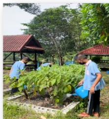
ฐานที่ ๒ แปลงผักรักพอเพียง