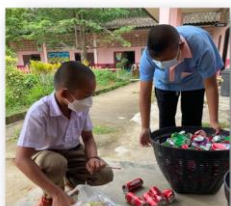
ฐานที่ ๔ ออมบุญวันละขวด