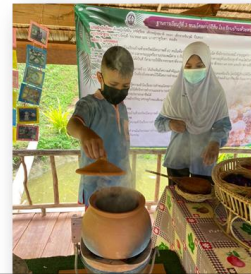
ฐานที่ ๓ ขนมโคหลากหลายสี