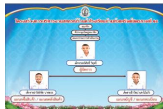
ฐานที่ ๖ สหกรณ์ปันสุข

๓. ถ่ายทอดองค์ความรู้ด้วยกระบวนการถอดบทเรียน (Lesson Learned : LL) ซึ่งเป็นวิธีการจัดการความรู้ ที่เน้นการเสริมสร้างการเรียนรู้ ที่เป็นระบบ เพื่อสกัดความรู้ที่ฝังลึกในตัวผู้เรียน และถ่ายทอดองค์ความรู้ออกมาเป็น บทเรียนด้วยตัวผู้เรียนเอง ทำให้ผู้เรียนเกิดการเรียนรู้ร่วมกัน อันนำมาซึ่งการ ปรับวิธีคิด และวิธีการทำงานที่สร้างสรรค์ และมีคุณภาพยิ่งขึ้น โดยเชื่อมโยง กับหลักปรัชญาของเศรษฐกิจพอเพียง ซึ่งสอดคล้องกับวิสัยทัศน์โรงเรียนที่ กล่าวไว้ว่า “ผู้เรียนมีทักษะแห่งศตวรรษที่ ๒๑ สอนสำเร็จเน้นผู้เรียนเป็น สำคัญ ส่งเสริมคุณธรรมนำวิถี ประสานภาคีด้วยหลักธรรมาภิบาล สืบสานปณิธานแห่งศาสตร์พระราชานำพาสู่อองค์กรแห่งการเรียนรู้”