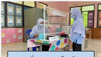
ฐานที่ ๕ ธนาคารโรงเรียน