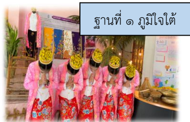
ฐานที่ ๑ ภูมิใจได้

๒. จัดการเรียนรู้ฐานสมรรถนะด้วยวิธีการ Active Learning เน้นการเรียนรู้ที่ผู้เรียน ได้ลงมือปฏิบัติ ด้วยตนเอง เป็นกระบวนการปรับการเรียนรู้แบบ Passive เป็นแบบ Active โดยเน้นการที่ผู้เรียนเป็นผู้ดำเนินการเรียนรู้ ลงมือปฏิบัติ (Learning by Doing) ต่อสิ่งที่เรียนรู้ด้วยตนเอง เพื่อให้เกิดความรู้ความเข้าใจอย่างแท้จริง โดยกิจกรรมฐานสมรรถนะใช้หลักการบูรณาการความรู้ ๘ กลุ่มสาระการเรียนรู้ และกิจกรรมพัฒนาผู้เรียน ประกอบด้วย ฐานการเรียนรู้ ดังนี้