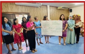
กลุ่มนิเทศติดตาม และประเมินผลการจัดการศึกษา สพป.พังงา